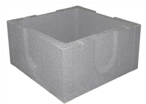
Caixa de Visita