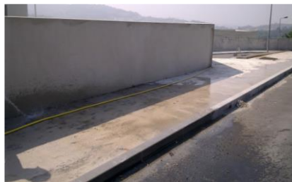
2. Preparação do suporte