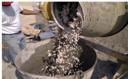
1. Amassadura da SCALA DECOR com adição de agregado