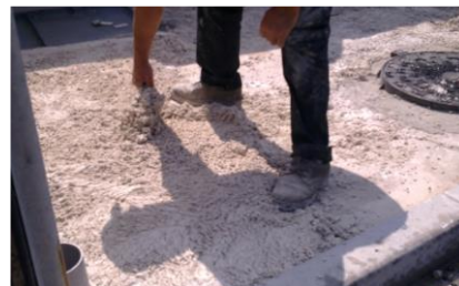
3. Colocação da argamassa SCALA DECOR