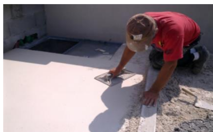
4. Talochamento da superfície