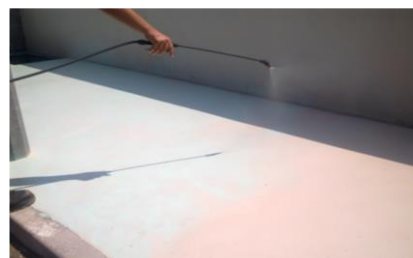
5. Aplicação do desativante de superfície SCALA AD 31 ou SCALA AD 32 para acabamento desativado