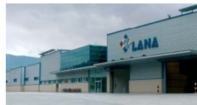
LANA, S. Coop.

Tel. +420 569 430 060 Fax. +420 569 430 061