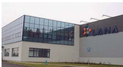
Czech LANA s.r.o.

Chrudimská 584 582 63 Ždírec nad Doubravou CZECH REPUBLIC