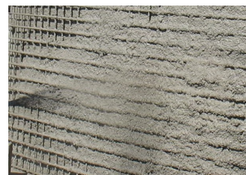
Aplicação da primeira camada