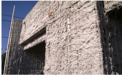
Espera entre camadas