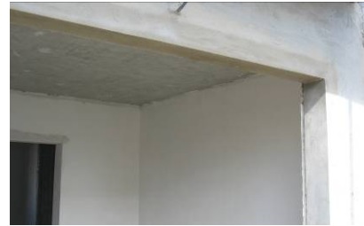
Aspeto final com talochamento