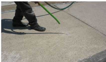
Limpeza da superfície

Aplicar o B-REPARA PROTEÇÃO AD 40 de modo uniforme a rolo, com uma trincha ou por pulverização, sobre suportes perfeitamente secos. As sucessivas camadas deverão ser aplicadas enquanto a anterior ainda se encontrar fresca, recomendando-se a aplicação de pelo menos duas demãos de B-REPARA PROTEÇÃO AD 40 .