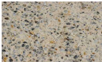
Aplicação do B-REPARA PROTEÇÃO AD 40