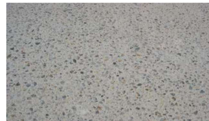
Aspetto final da superfície tratada