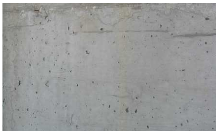
Suporte de betão com defeitos

PASTA DE ACABAMENTO CINZA PARA REPARAÇÃO ESTÉTICA DE BETÃO