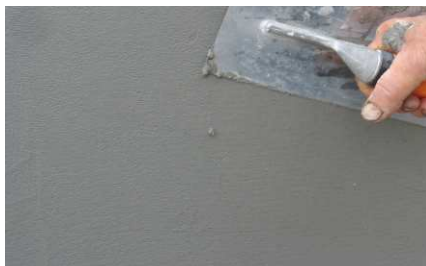
Aplicação do B-REPARA FACE KC