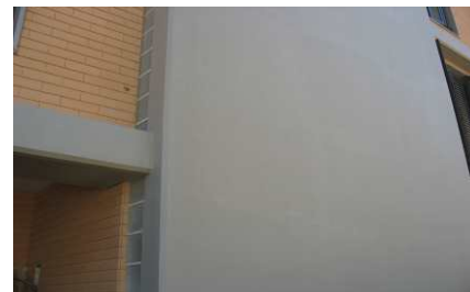
Aspeto final após aplicação do B-REPARA FACE KC PROTEÇÃO AD 05