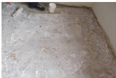
Aplicação do primário MICROART AD 21

Depois de misturado, verter o material sobre o pavimento, recorrendo a uma talocha ou espátula para nivelar a superfície. Se necessário passar o rolo de bicos para remover eventuais bolhas de ar.