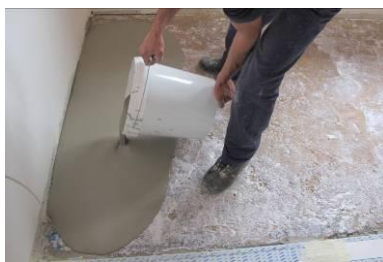
Aplicação do PLAN LEVEL 315