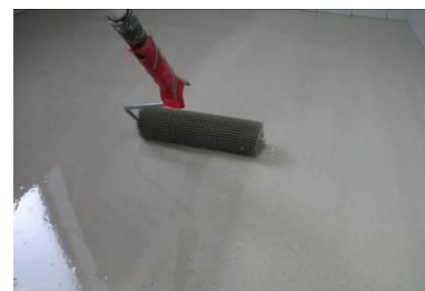
Uniformização da superfície c/ rolo de bicos